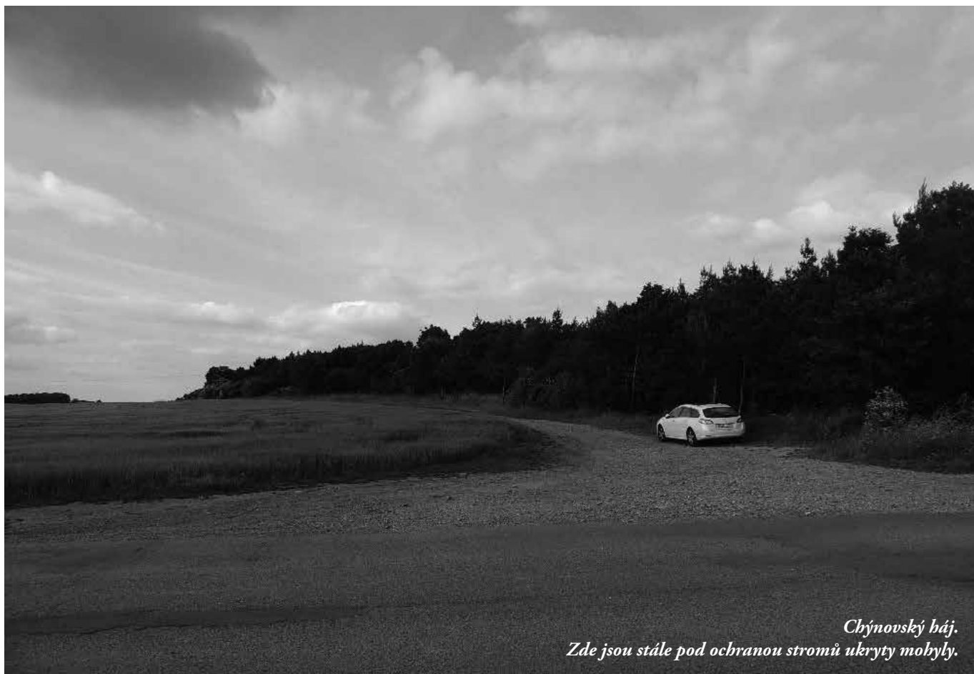
Chýnovský háj. Zde jsou stále pod ochranou stromů ukryty mohyly.

a výpovědích „pamětníků“. To je příčinou, proč celá jeho kronika obsahuje množství historických chyb. Můžeme ji tak brát z velké části spíše jako sbírku lidových pověstí a pověr. Lucká válka, kterou v upravené podobě přebral i Hájek a po něm Jirásek, tak mohla být směsicí skutečných historických událostí a lidových pověstí. Pravděpodobně k nějakému konfliktu mezi těmito slovanskými kmeny, případně mezi dominantními Přemyslovci a jiným kmenem, skutečně došlo. V té době to ostatně nebylo nic výjimečného a docházelo tím k formování našeho státu tak, jak jej známe z pozdějších dob a přeneseně až dodnes. Že se však rozhodující nebo jakákoli bitva odehrála právě na polích v okolí